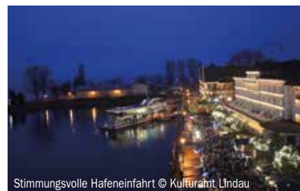
Stimmungsvolle Hafeneinfahrt

Weihnachtsmärkte gibt es viele, doch nur Lindau hat eine Hafenweihnacht. Dank ihrer einzigartigen Lage – vor der Kulisse schneebedeckter Berge und direkt am Wasser – zählt die Lindauer Hafenweihnacht zu den schönsten Weihnachtsmärkten des Landes. Nirgendwo ist die Kulisse romantischer als direkt am Bodensee mit dem Alpenpanorama in der Ferne. Zu einem Bummel laden nicht nur die liebevoll geschmückten Marktstände entlang des Hafengeländes ein, sondern die ganze festliche Weihnachtsinsel verlockt dazu, die Runde auf die glanzvoll dekorierte Altstadt auszudehnen. Auch das vorweihnachtliche Programm ist vielfältig und abwechslungsreich: Es reicht von adventlichen Stadtführungen, Nachtwächterrundgängen, Schiffsrundfahrten und Showeinlagen bis hin zu einem musikalischen Programm, das für weihnachtliche Stimmung sorgt. Besonders beliebt ist der Stadtrundgang mit dem Nachtwächter, der die Gäste durch die festlich geschmückten Gassen geleitet und sie mit viel Humor in so manche Geheimnisse einweiht.