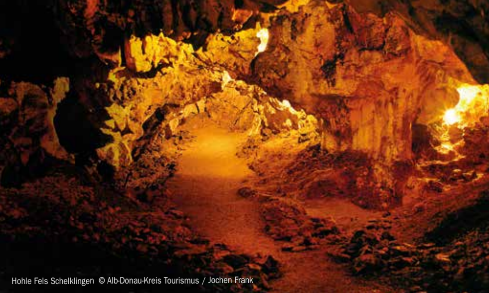
Hohle Fels Schelklingen