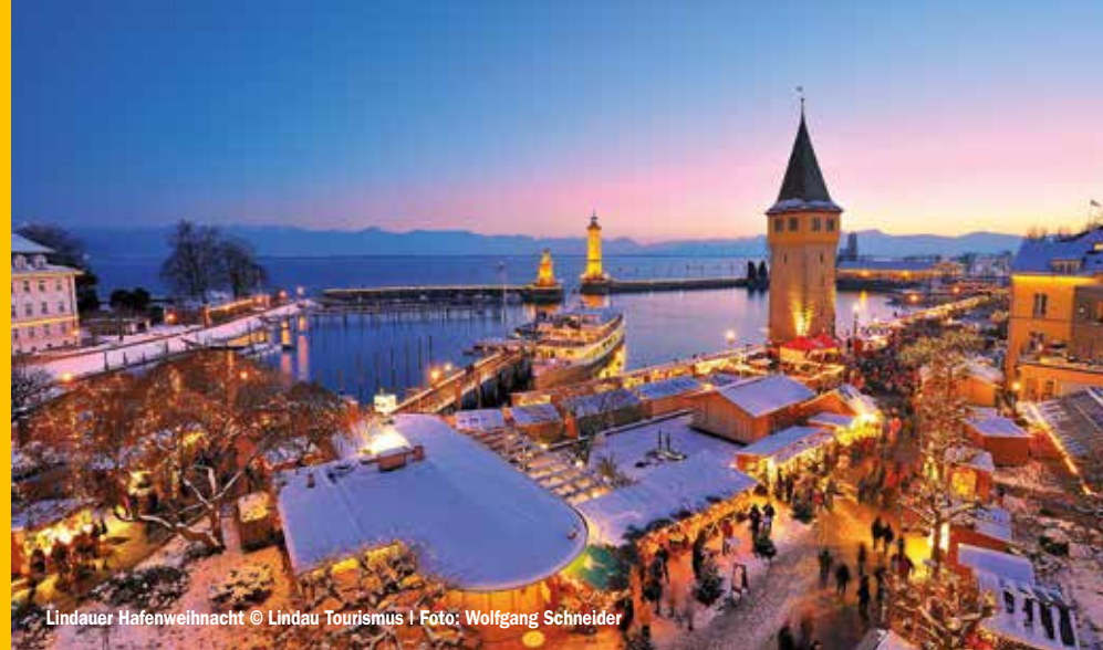
Lindauer Hafenweihnacht