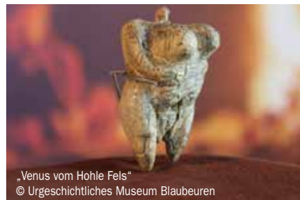
„Venus vom Hohle Fels“

Die Schwäbische Alb war in vorgeschichtlicher Zeit besiedelt. Davon zeugen sechs Höhlen und die umliegende Landschaft, die unter dem Titel „Höhlen und Eiszeitkunst der Schwäbischen Alb“ in die UNESCO-Welterbeliste eingetragen sind. Höhlenfunde und Kunstwerke belegen eine frühe Besiedlung vor 40.000 Jahren und zeigen, dass in unserer Region die Wiege der Kunst und Kultur zu finden ist. Neandertaler und anatomisch moderne Menschen lebten hier während der letzten Eiszeit. Die Funde sind Nachweise der ersten menschlichen Versuche, Tiere und Menschen figürlich darzustellen. Die wohl bedeutendsten Funde sind der „Löwenmensch“, ein geheimnisvolles Mischwesen aus Mensch und Löwe, und die „Venus vom Hohle Fels“, die zugleich die älteste figürliche Darstellung